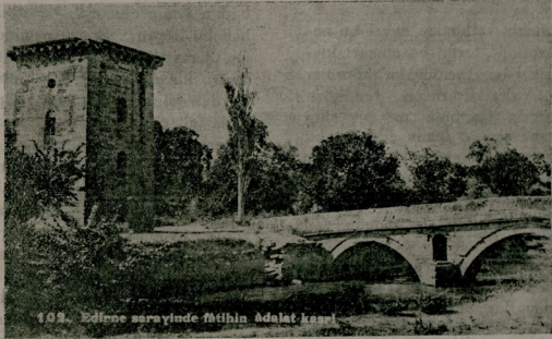
102. Edirne sarayında Fâtihin Adalat kesiği

Ayşekadın hanlarile, Bedesten Alipaşa, arasta gibi çarşılarla ve daha bir çok âbidelerle süslenen ve ilâhi ve mimari bir azamet gösteren bu Türk yurduna bu köprülerin de